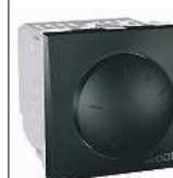
spécial tube fluo 1-10 V