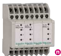
Module d'extension TMYAHRP00002