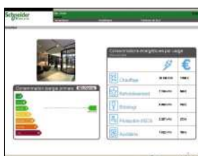
Tableaux de bord personnalisés